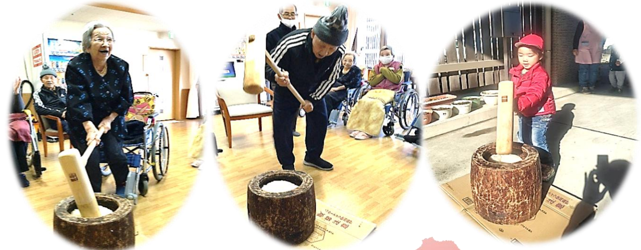
12月26日 餅つき 葛生保育園の子供たちが参加して下さいました。